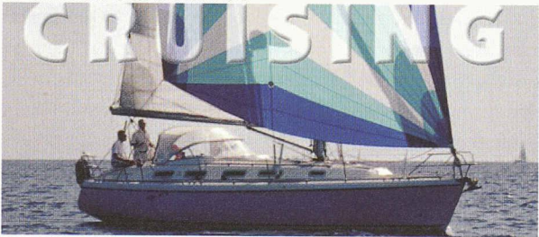
En mer ou sur nos lacs, nous réalisons des voiles de croisière pour toutes les tailles de bateau.