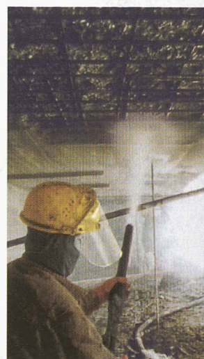
• Réfection et protection du béton