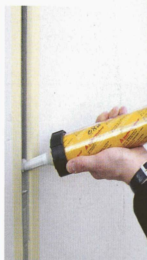
• Systèmes d'étanchéité pour joints