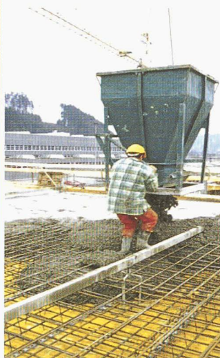
• Fabrication de béton et de mortier