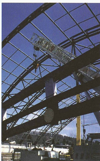
• Protection anticorrosion et protection ignifuge