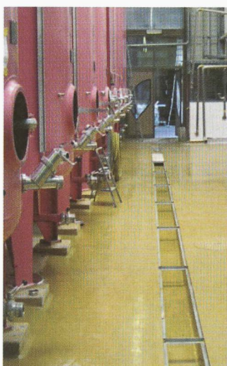
• Revêtements de sols