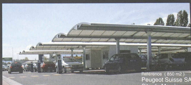
Référence ( 850 m2 ) Peugeot Suisse SA Site de Meyrin