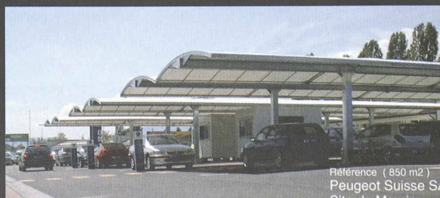
Référence ( 850 m2 ) Peugeot Suisse SA Site de Meyrin