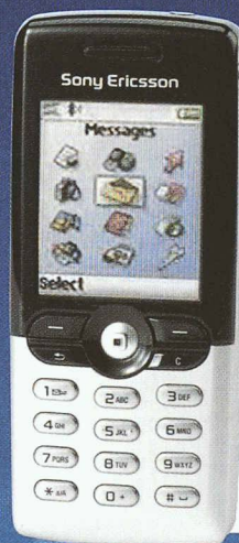
Sony Ericsson T610

Profitez! Dès maintenant dans tous les Swisscom Shops ou chez votre revendeur spécialisé. Offre valable jusqu'au 31.12.2003.