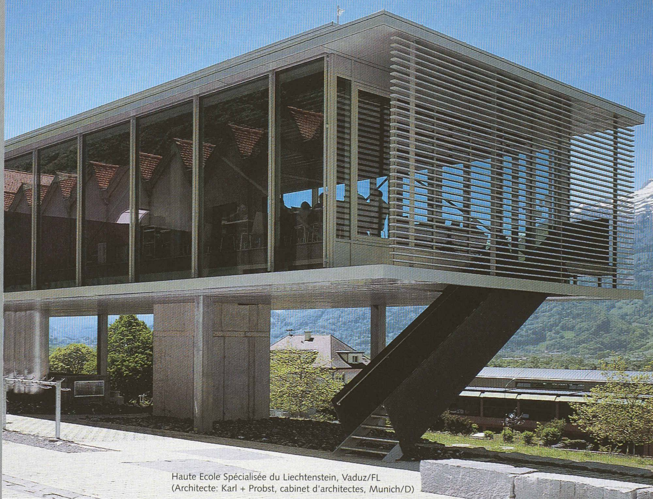
Haute Ecole Spécialisée du Liechtenstein, Vaduz/FL (Architecte: Karl + Probst, cabinet d'architectes, Munich/D)

Des solutions avec des systèmes innovants