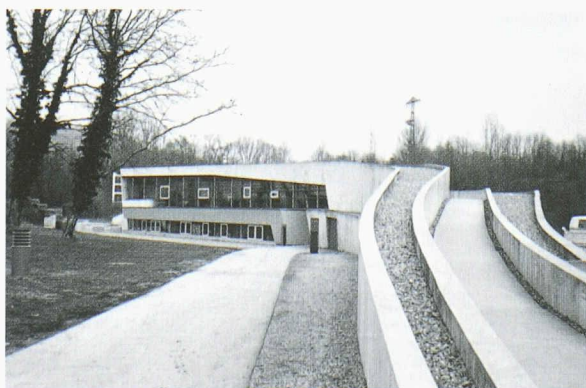
Centre international de l'Environnement, Weil-am-Rhein