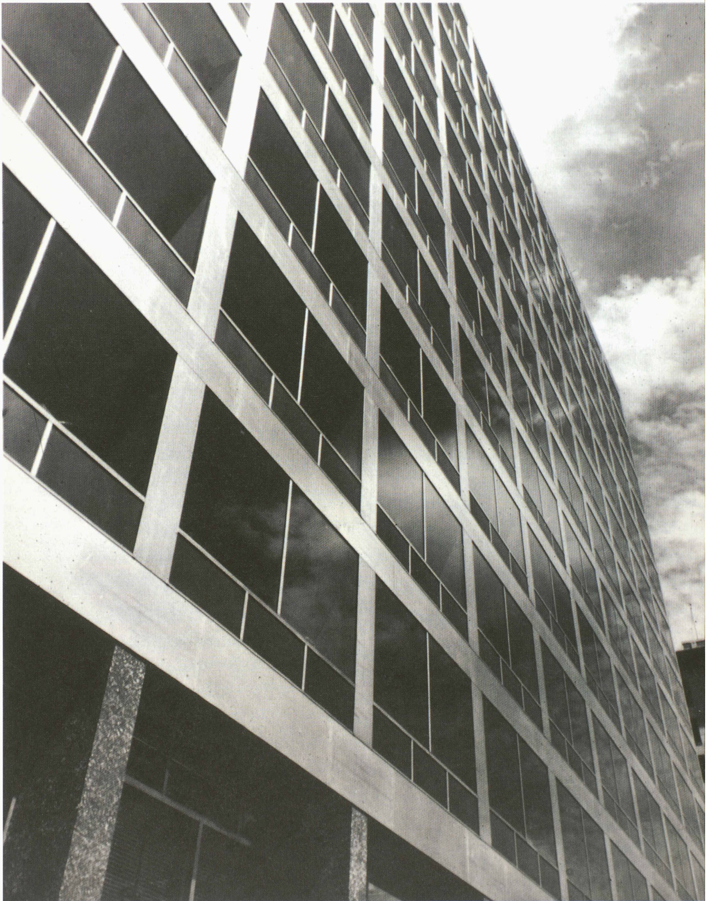
Fig. 1 : Pietro Belluschi : Equitable Savings and Loan Association, Portland, 1948