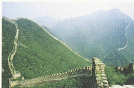
La grande muraille de Chine (Documents Internet < www.hebus.com >)