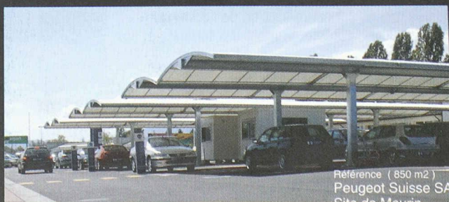
Référence ( 850 m2 ) Peugeot Suisse SA Site de Meyrin