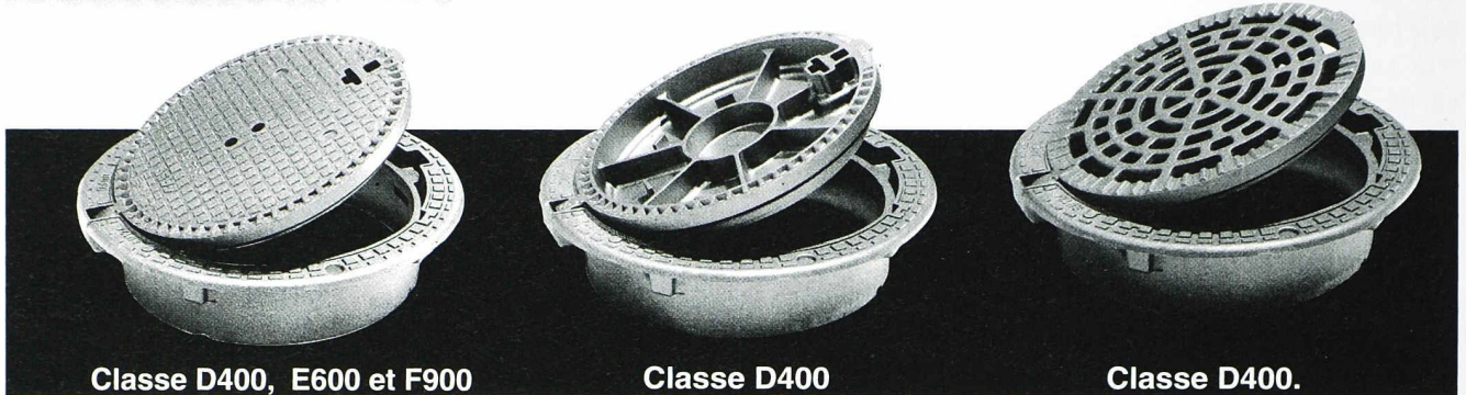
Classe D400, E600 et F900 avec ou sans verrouillage (ventilé ou non en D400).