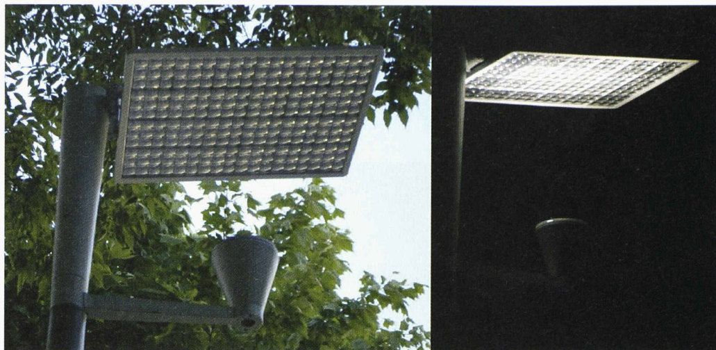
Fig. 1 : Aviso-NumeLiTe, l'un des deux types de luminaires installés à Albi, de jour (à gauche) et de nuit (à droite)

décharge électrique. NumeLiTe est coordonné par le groupe français « Sources Intenses de Photons » du Centre de physique des Plasmas et de leurs Applications de Toulouse (C. P. A. T). Cette équipe de recherche s'intéresse depuis plus de 30 ans aux sources lumineuses pour l'éclairage et pour des applications industrielles. Le coût total du projet s'élève à 6,6 millions d'euros. Il a été subventionné par la Communauté européenne à hauteur de 2,8 millions d'euros. Les membres suisses et anglais du consortium ont été subventionnés par leurs gouvernements pour un montant de 0,5 million d'euros chacun.