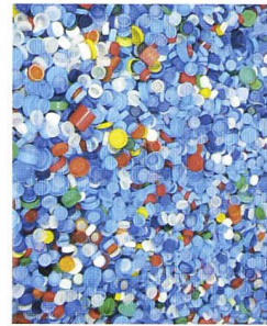
Bouchons PET