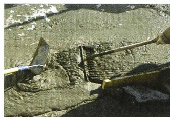
Le BEUP, à la fois autocompactant et rhéologique, est travaillé avec des outils standards

le pont de Peney dix ans après Philippe Annen et Gérald Hoiler