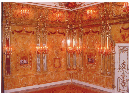
< www.puppenhausmuseum.ch > L'exposition « Le cabinet d'ambre en miniature » est prolongée jusqu'au 17 octobre 2006

La grande question quand on se penche sur la jolie miniature posée au milieu des jolies maisons de poupées du Puppenhausmuseum, c'est de savoir si les souffrances humaines sont reproductibles à l'échelle 1:12.