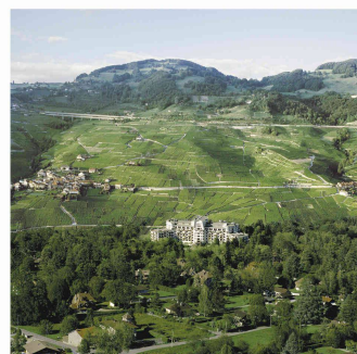
Lavaux - Evian (Photomontage Made in Genève)

Pays, paysage, « empaysagement » Francesco Della Casa