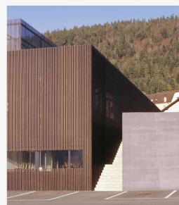
Centre commercial à Genèva. Genèvasca-Delleforine architectes, Neuchâtel

Eléments du collectif Francesco Della Casa