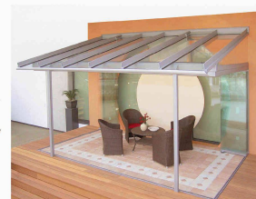
Solarlux (Schweiz) AG Industriestrasse 34C CH - 4415 Lausen < www.solarlux.ch >

lumières et les transformateurs sont placés dans le profilé. La toiture de terrasse SDL-Atrium peut également être adaptée en serre, grâce au système SL 25 en verre structural ou au système SL 25R cadré avec profils fins, qui offre une vue libre sur le jardin tout en offrant une protection contre le vent et la pluie. Les vantaux en verre se laissent manipuler avec aisance sur les côtés. Une aération permanente est garantie, l'ombrage intérieur et extérieur est également possible.