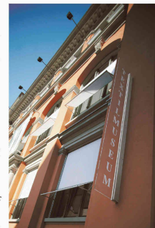
Griesser AG Tänikonstrasse 3 CH - 8355 Aadorf < www.griesser.ch >

Il était important que l'installation de protection solaire entièrement automatique ne réagisse pas uniquement à l'incidence lumineuse mais aussi au vent. Grâce à la commande Griesser Compact , les commandes automatiques peuvent être dirigées manuellement à tout moment par les responsables. Lors de l'installation des câbles électriques, l'espace intérieur à protéger du musée du textile a été pris en compte. La solution radio les a rendus en grande partie invisibles.