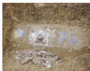
Tête d'ancrage délogée

Réaction alcali-granulats Pascal Kronenberg et Christine Merz