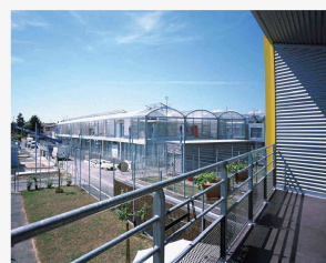
Cité Manifeste à Mulhouse, l'intervention de Lacaton/Vassal

Sécheron, une dynamique à deux vitesses Francesco Della Casa