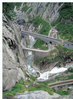
Les routes historiques du Gotthard, le pont du Diable

Une vision pour la Surselva ? Stefan Forster