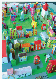
Maquette réalisée par des enfants, dans le cadre des animations de sensibilisation à l'environnement construit (Photo Tribu architecture, projet lauréat de la DKA)