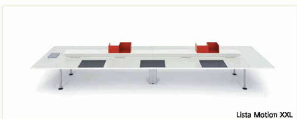
Lista Motion XXL