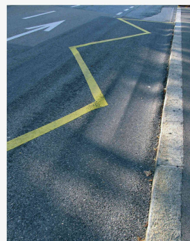
La complexité dans la banalité quotidienne: le phénomène de la formation des ornières sur l'asphalte. (voir p. 14)

Stratégies de recherche pour le génie civil Anna Hohler, Ian F. C. Smith