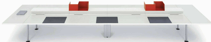
Lista Motion XXL