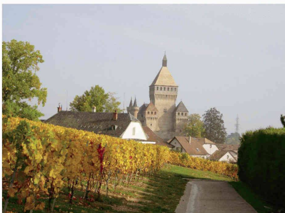
Lors d'une promenade proposée par Pierre Corajoud

Édition SEPT. Société des amis des associations à but non lucratif 55 rue de la Chapelle - 1201 Genève - Tél. 022 348 38 21 - Fax 022 348 38 81 - sewa@sewa.ch Site Web: www.sewa.ch Région des montagnes. C.A. Alpes de la Vallée de la Grande Moraine - 1224 Châtillon - Tél. 022 348 38 21 - Fax 022 348 38 81 - sewa@sewa.ch Association de la Vallée de la Grande Moraine. C.A. Alpes de la Vallée de la Grande Moraine - 1224 Châtillon - Tél. 022 348 38 21 - Fax 022 348 38 81 - sewa@sewa.ch Association de la Vallée de la Grande Moraine. C.A. Alpes de la Vallée de la Grande Moraine - 1224 Châtillon - Tél. 022 348 38 21 - Fax 022 348 38 81 - sewa@sewa.ch Association de la Vallée de la Grande Moraine. C.A. Alpes de la Vallée de la Grande Moraine - 1224 Châtillon - Tél. 022 348 38 21 - Fax 022 348 38 81 - sewa@sewa.ch