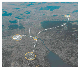
Projet « Stadttunnel » à Zurich (Document Linsi, Thiry et Güller)