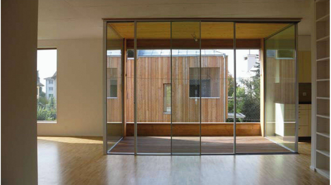
Fig. 6 : Continuité visuelle entre les espaces « jour » et intégration de la loggia