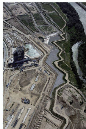
Le parc « Meandro plateado » en chantier

La Suisse et l'eau à Saragosse Jacques Perret