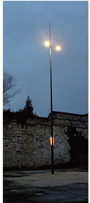
Petitjean Distributeur en Suisse MIAUTON SA CH - 1844 Villeneuve < www.miauton.ch >

à faible consommation d'énergie. L'entreprise travaille sur cette question notamment au sein du projet Novaled qui rassemble chercheurs et entreprises. Le TAL se compose d'une paire de vasques translucides. Ces coques thermoformées (à partir de feuille en polycarbonate) se plaquent dos à dos sur des poteaux spécialement préparés en usine par Petitjean pour recevoir cette greffe. A l'intérieur des vasques, des barreaux lumineux étanches renferment les LEDs. On compte 15 diodes électroluminescentes de type RGB ( Red Green Blue ) par barreau. Leur fabricant, Osram annonce une durée de vie de l'ordre de 50 000 heures.