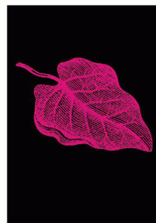
Cocculus lacinoeus

Projets primés du concours international Francesco Della Casa