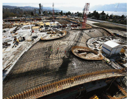
Le chantier du Rolex Learning Center

Conception des façades vitrées Pierre-Olivier Spagnol