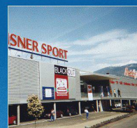
Media Markt, Conthey