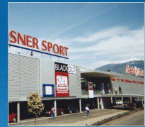
Media Markt, Conthey