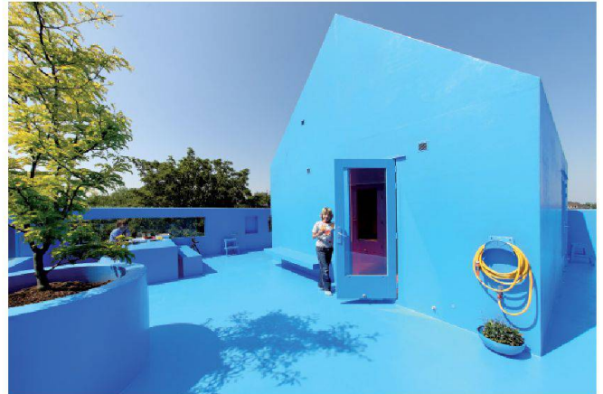
Didden Village. Prothèse d'habitation sur le toit d'un immeuble de Rotterdam