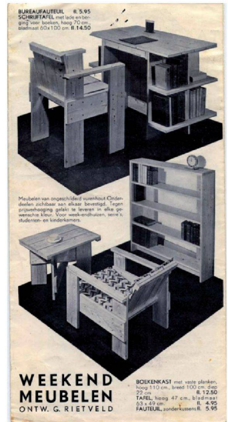
Brochure publicitaire de 1935 pour un ouvrage de meubles à faire soi-même

Aujourd'hui, l'heure n'est plus aux manifestes. Nous sommes au temps des séries limitées, des rééditions fidèles, de l'orthodoxie et du purisme stylistique érigés en manière. Autant dire qu'à Vitra, ce temple du consumérisme raffiné, Rietveld s'expose dans ce contre quoi il a lutté toute sa vie. CC