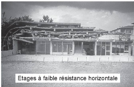
Etages à faible résistance horizontale