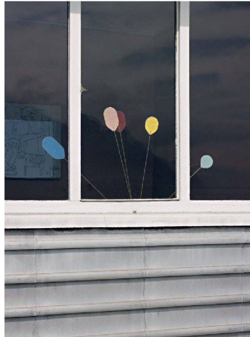
Les fleurs du lac, ECAL-Jonathan Vallin