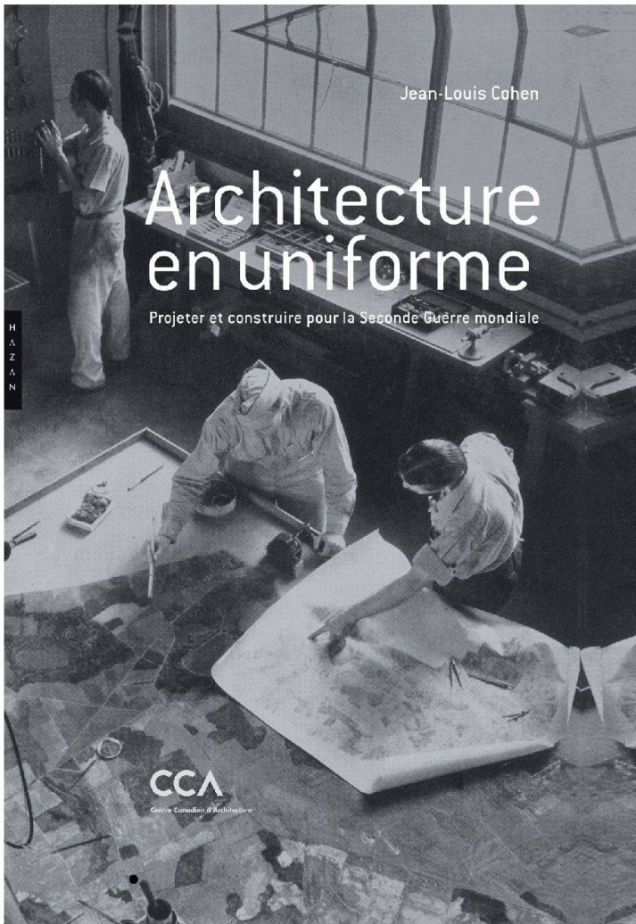
Fig. 3 : Publication Architecture en uniforme : Projeter et construire pour la Seconde Guerre mondiale, 2011