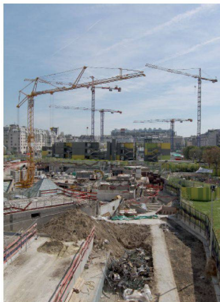
Vue du chantier des Halles, au fond le Centre Pompidou