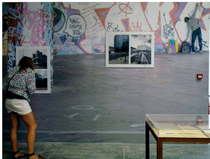
Vue de l'exposition de l'OMA au pavillon central des Giardini