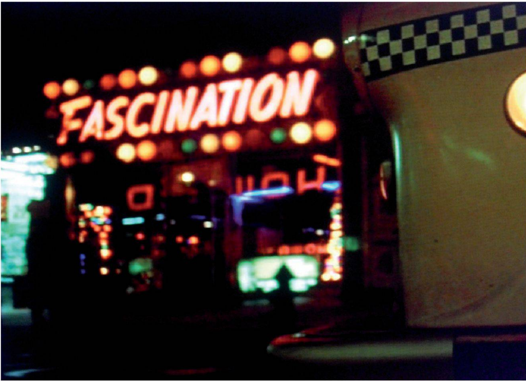
5, 6, 7 Martin Scorsese, Taxi Driver , 1975 8 Sou Fujimoto, House N , 2008

que d'insérer, dans une même expérience spatiale, une multiplicité de points de vue simultanés, pour en extraire le diagramme. Eisenstein s'est attaqué à cette question dans le projet Glass House : un film qui serait entièrement absorbé dans l'exploration de son propre décor de verre, fait de plans transparents en suspension dans l'espace 3 . Avec le risque, justement pointé naguère par Colin Rowe et Robert Slutzky au sujet des compositions axonométriques de van Doesburg ou d'El Lissitzky, que ces élégantes compositions de plans flottants s'épuisent dans la production d'une transparence à la fois littérale et allégorique, c'est-à-dire finalement décorative 4 .