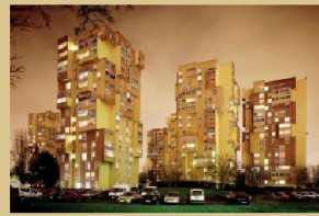
Cyrilus Cornut, Les tours marrons, Sevran, 2011

EXPOSITION GRANDS ENSEMBLES, 1960-2010 Archipel Centre de Culture Urbaine 21 place des Terreaux F - 69001 Lyon www.archipel-cdcu.fr