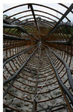
Équipement d'un pieu énergétique