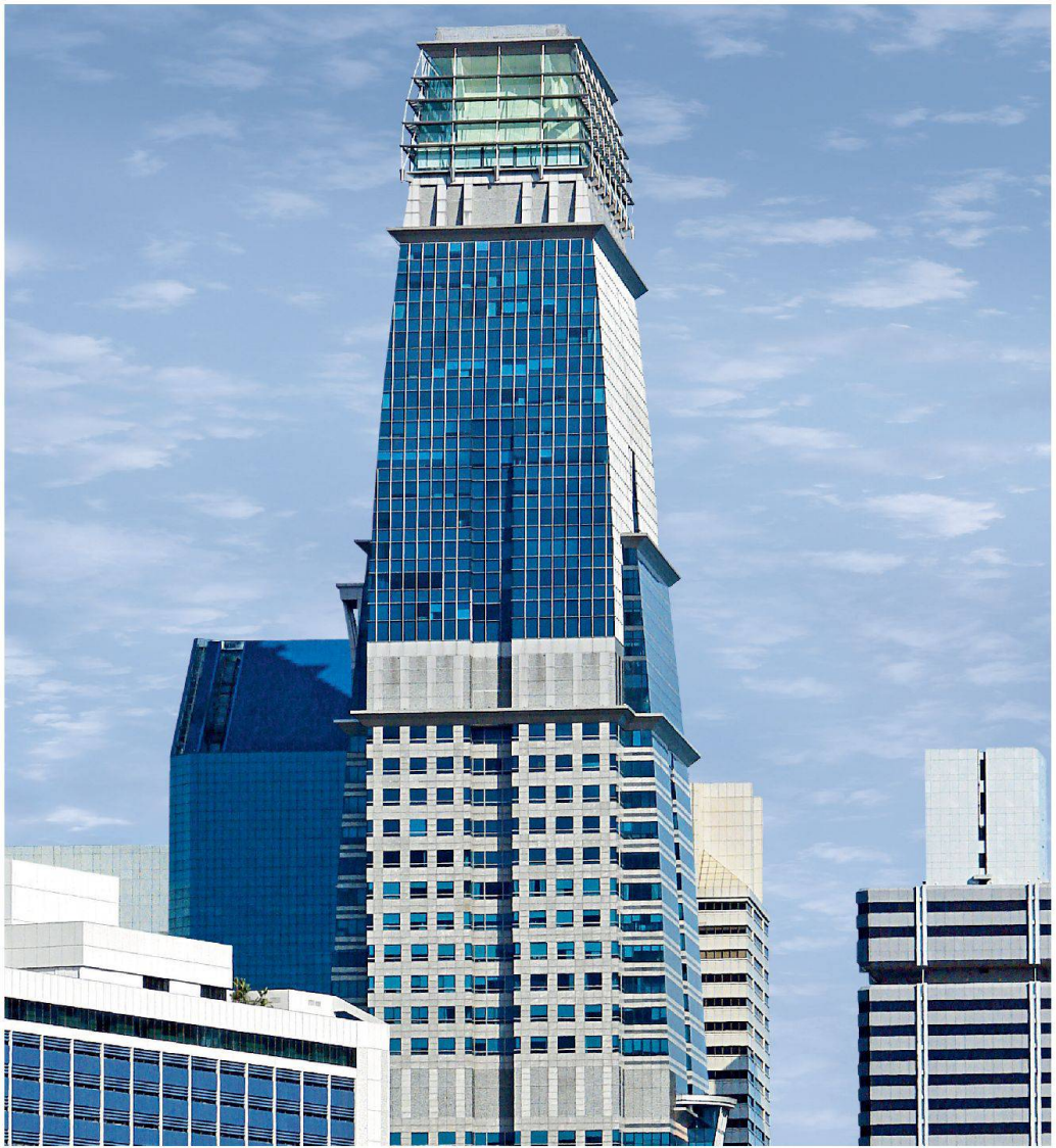
Singapore Capital Tower