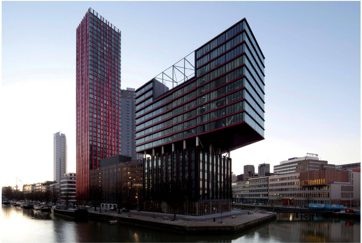
Fig. 3 : The Red Apple de KCAP