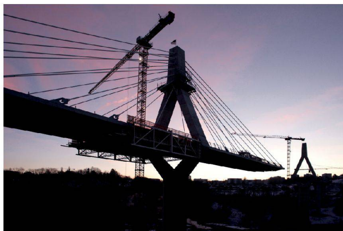
Vue du pont de la Poya