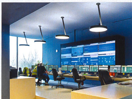
Aperçu du centre de commande de l'usine de traitement des ordures de Forsthaus près de Berne

Allant au-delà de stricts ouvrages fonctionnels, de tels projets, conçus par des équipes mixtes d'ingénieurs et d'architectes, ont constitué le fil rouge du périple organisé cette année par le groupe professionnel Architecture (BGA) pour sa journée qui a attiré une centaine de professionnel-le-s. Le long de la Transjurane, les architectes Flora Ruchat-Roncati et Renato Salvi se sont penchés en détails sur l'intégration paysagère de cet axe routier et ont développé un langage architectural spécifique pour l'ensemble de l'ouvrage: les sculptures de béton qui signalent les installations de ventilation, la conception soignée des passages sous voies, le traitement des parapets et des piles lui confèrent ainsi une identité tout à fait originale.