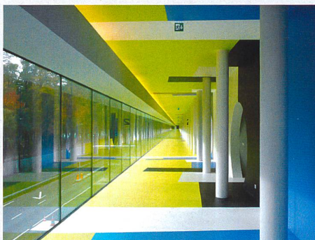
Bâtiment industriel vitré: couloir de l'usine de traitement des ordures