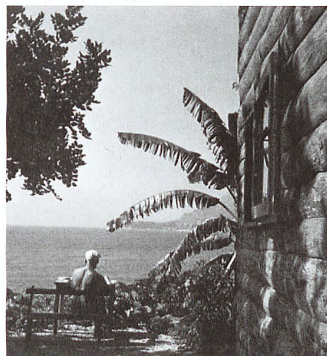
( Le Corbusier devant le cabanon, Cap Martin - Roquebrune 1951.)

EXPOSITION LUCIEN HERVÉ: LES VACANCES DE MONSIEUR LE CORBUSIER Fondation Le Corbusier, Maison La Roche, Paris www.fondationlecorbusier.fr