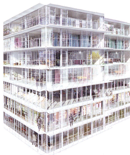
Projet SARA (Image Lacaton & Vassal architectes)